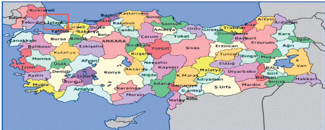
Harita 1 - İstanbul'un Konumu

İstanbul, Türkiye'nin en büyük kenti olup, 15 milyon kişiyi aşan nüfusu ile dünyanın da sayılı kentlerinden biri haline gelmiştir. Batı ile Doğu arasında köprü olma özelliği ile yerli ve yabancı sermaye için, bölgelerarası ilişki kurma ve bölgelere açılma yönünden önemli bir merkezdir. İstanbul Boğazı, Karadeniz'i, Marmara Denizi'yle birleştirirken; Asya Kıtası'yla Avrupa Kıtası'nı birbirinden ayırmakta ve İstanbul kentini de ikiye bölmektedir.